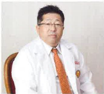
国際心理カウンセラー総合学院 学院長